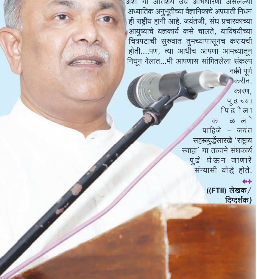
(FTII) लेखक/ दिग्दर्शक